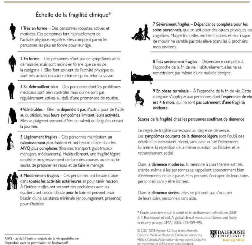
Figure 1. Échelle de la fragilité clinique

A propos des patients hospitalisés en USLD et en EHPAD : les mesures de confinement et d'isolement doivent être appliquées à la règle dans cet environnement de patients fragiles à haut risque d'infection. Par ailleurs, les régulateurs du SAMU doivent avoir un accès facile aux éventuelles directives anticipées et aux notes écrites dans le dossier médical. Ainsi, un médecin d'astreinte doit pouvoir être contacté H24 pour participer le cas échéant à la décision collégiale de non admission en réanimation. Une réflexion sur les modalités optimales d'information des familles doit être entreprise dans un contexte d'interdiction de visites et de possibilité de dégradation brutale.